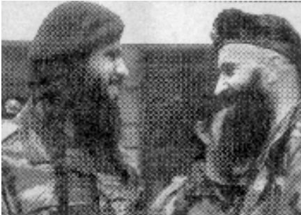
موسلمانان ته مپۆ چیتره و موسلمانان لاوازو ده ستوه ستانه ی چاران نییه

مه بهستی ده سه لاتداران چه کردنی نه یارانه، مه بهستی زله یزه کانیش چه کردنی هه ردوو به هه یزه کانی تر و به یه یزه کانه. نه گهر